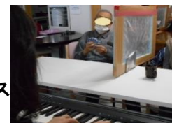
ピアノ演奏で 心身リラックス

冬の運動不足解消に、みなさん身体全体を動かしたり、手足の運動など全身の機能向上にと寒い時期を乗り越える為頑張っています。