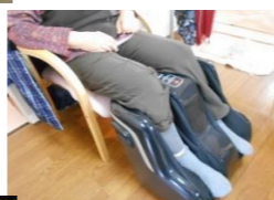
ふくらはぎが楽になった～