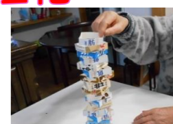
しっかり集中 しています！