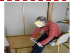
棒体操で全身運動