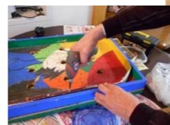
得意な事を活かした 役割療法

冬の運動不足解消に、みなさん身体全体を動かしたり、手足の運動など全身の機能向上にと寒い時期を乗り越える為頑張っています。