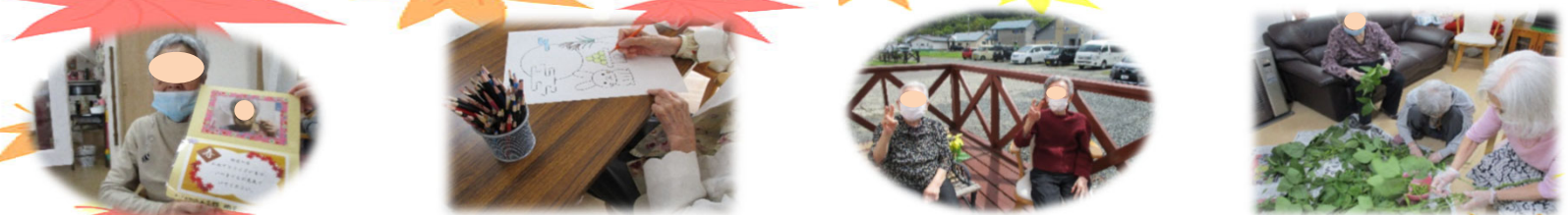
敬老の日、いつもありがとう！いつも元気です！