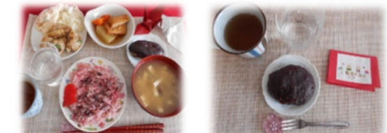
敬老の日 お祝い御膳です。