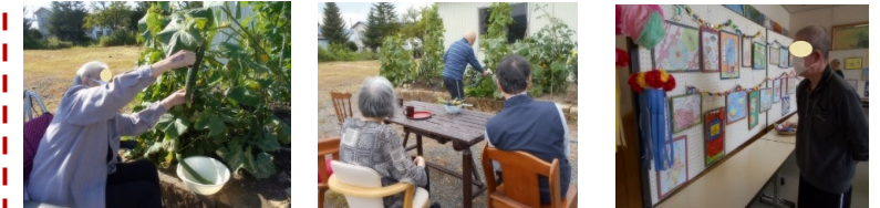
キュウリ大きいね～